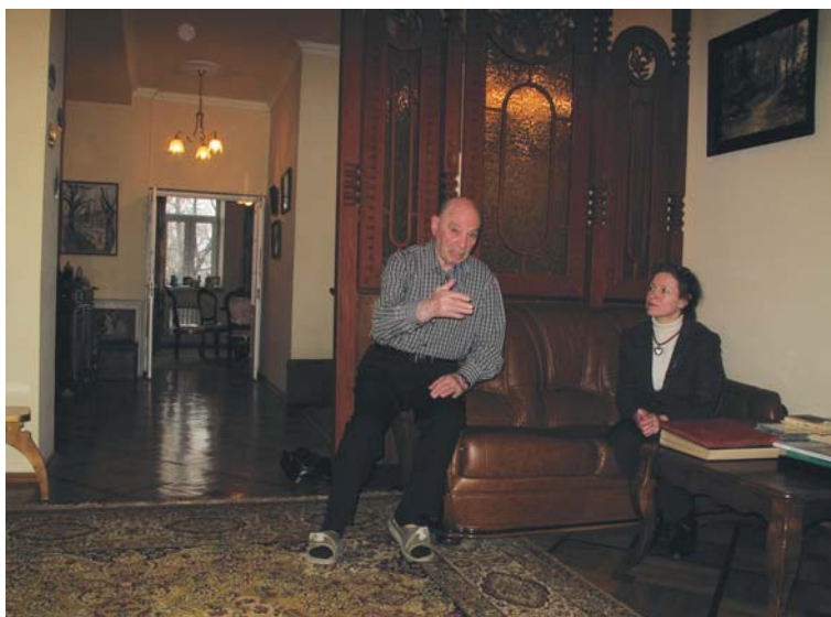
Для ветерана внимательный слушатель — большая удача