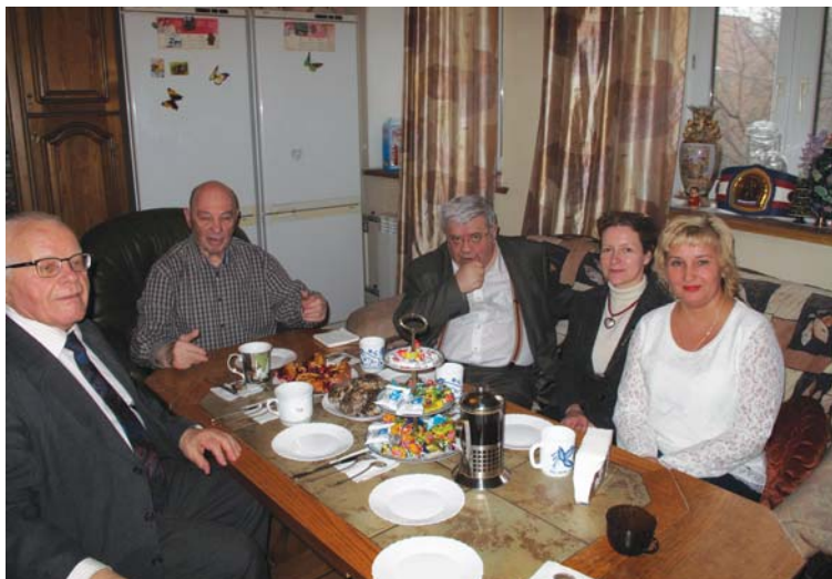
Жизнь как сказка... со счастливым концом

Смелость нашего героя имеет нравственные основания: нападавшие на него конъюнктурщики и политиканы были жуликоваты, мечтали грабануть Туманова, а он не имел нужды что-либо скрывать, его честность и открытость были видны любому человеку. Главным обвинением было: откуда у Туманова столько денег, ведь советский человек должен быть нищим. И это еще одна его заслуга, он дока-