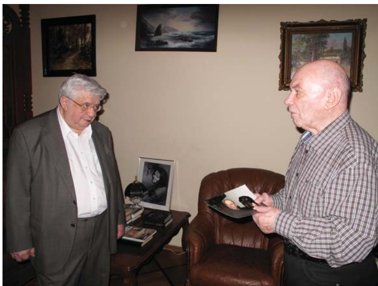
Такие необыкновенные приключения, не верится, что это возможно