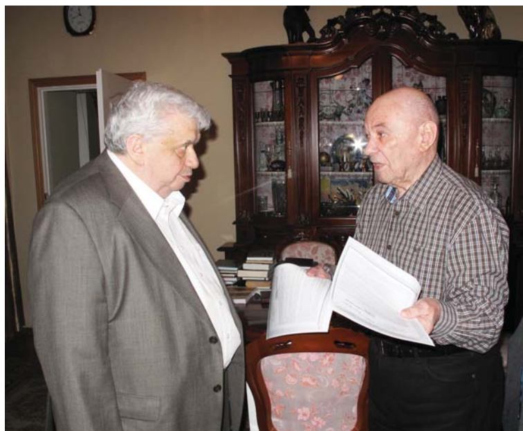
Издатели, историки, писатели будут еще долго изучать документы экономических инициатив Туманова