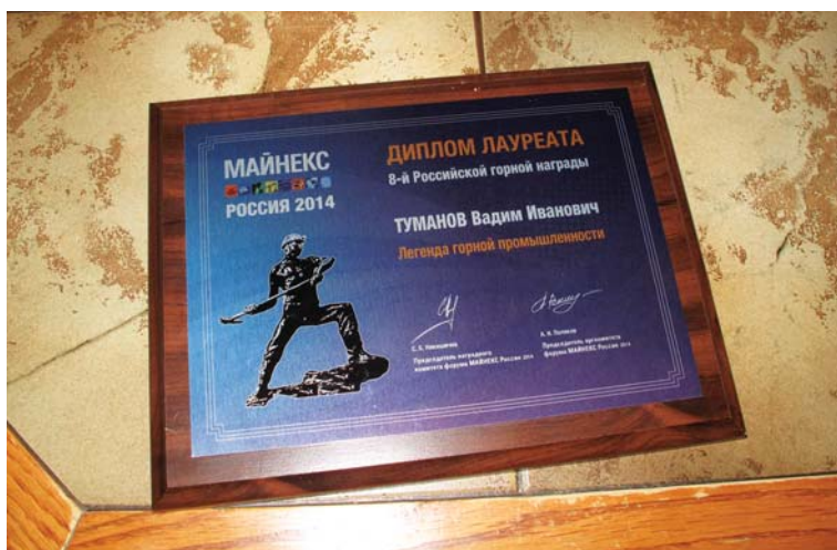
Очередное подтверждение легендарности Туманова